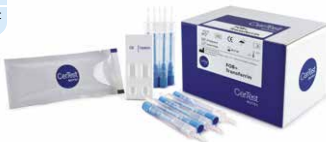
Certest FOB-Transferrin Combo Card, 20 tester, FT882001F